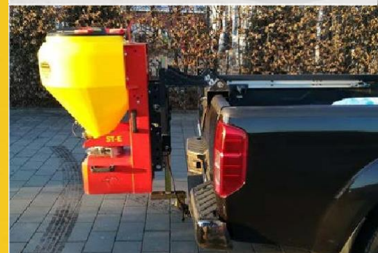
Salzstreuer mit Bordwandhalterung