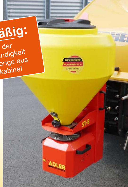
Salzstreuer im Hof-/Radladeranbau