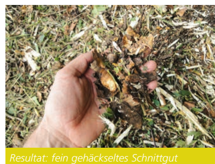
Resultat: fein gehäckseltes Schnittgut